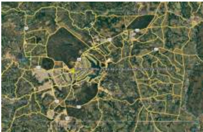
Figura : Localização da usina de produção de asfalto da NOVACAP

1.8. Nesta ocasião, cumpre ainda informar que a usina de produção de asfalto do Distrito Federal é um regulador de preço de mercado deste material , onde o Governo do Distrito Federal não fica refém da oferta de material pelas empresas que fornecem esses insumos/equipamentos. Podendo ainda, arcar com a finalização de obras inacabadas por problemas de falência de empresas ou abandono de obra / devolução de contratos e impossibilidade de repactuação e aditivo temporal que estejam envolvidos em obras públicas, finalização de obras para evitar prejuízos provocados por decisões judiciais e tantos outros motivos.