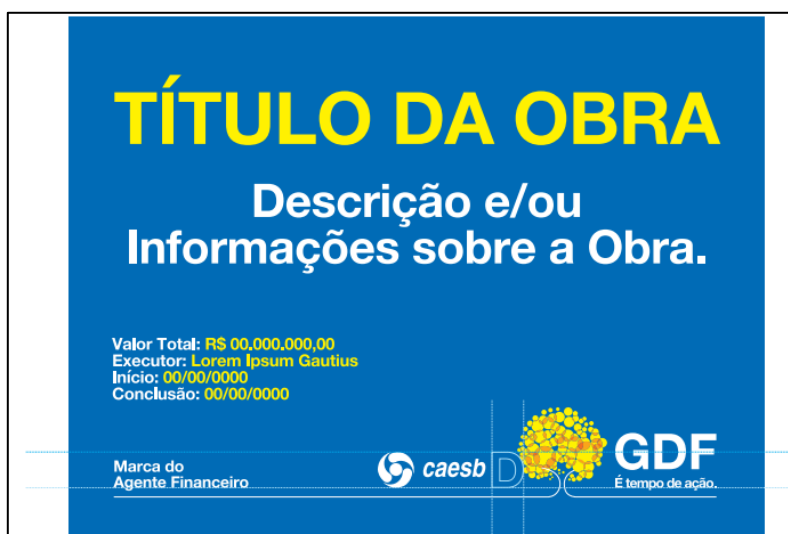
MODELO DE LONA VINÍLICA IMPRESSA