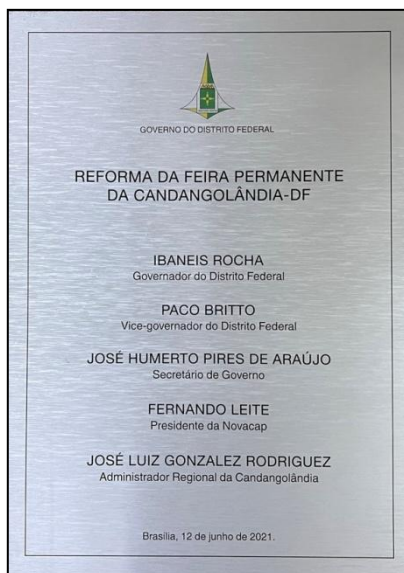
MODELO DE PLACA DE INAUGURAÇÃO EM PVC