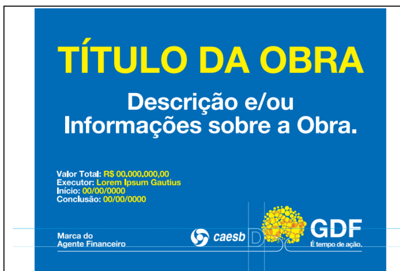
MODELO DE PLACA DE OBRA