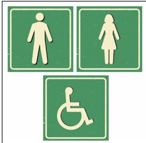
MODELO DE PLACA DE IDENTIFICAÇÃO EM PVC