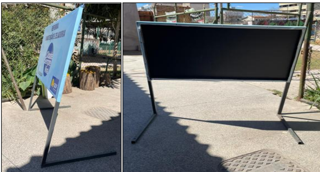
MODELO DE PLACA DE SINALIZAÇÃO VISUAL EM CAVALETE