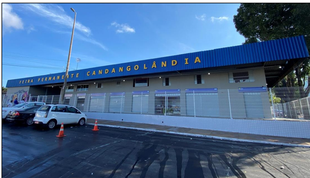
MODELO DE PLATIBANDA METÁLICA