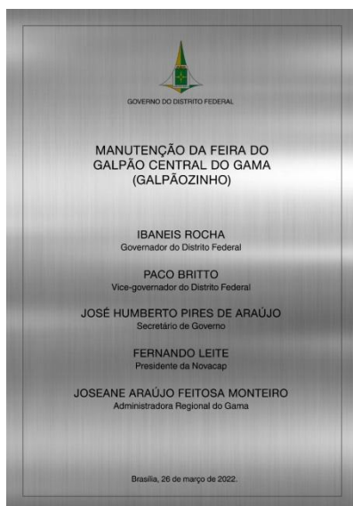
MODELO DE PLACA DE INAUGURAÇÃO EM AÇO INOX ESCOVADO