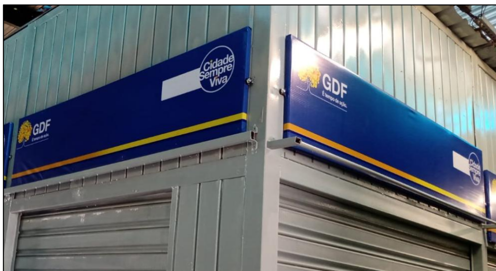
MODELO DE PLACA DE IDENTIFICAÇÃO EM LONA VINÍLICA