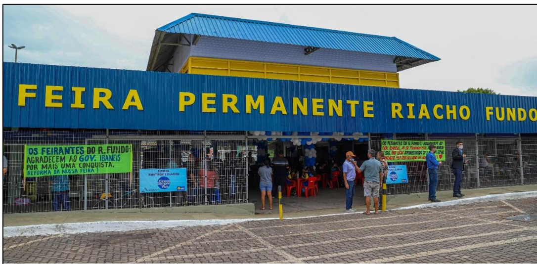
MODELO DE LETRA CAIXA EM PVC