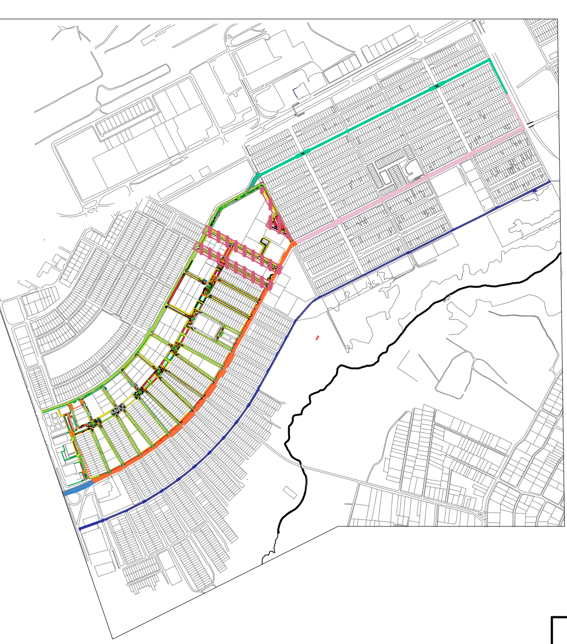
MAPA CHAVE TAGUATINGA SUL