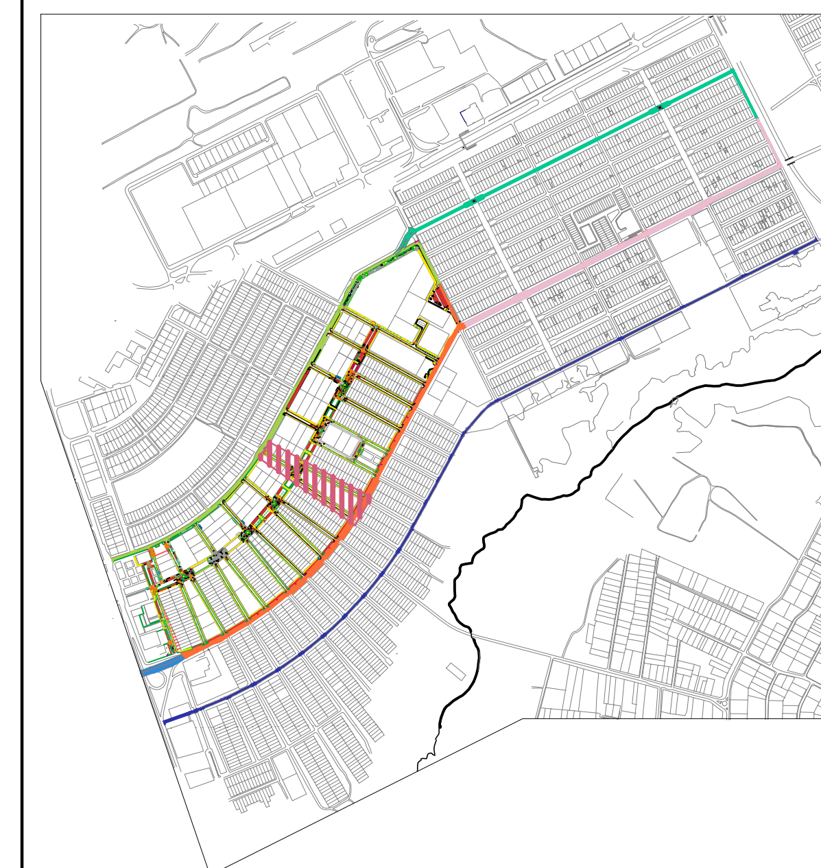
MAPA CHAVE TAGUATINGA SUL