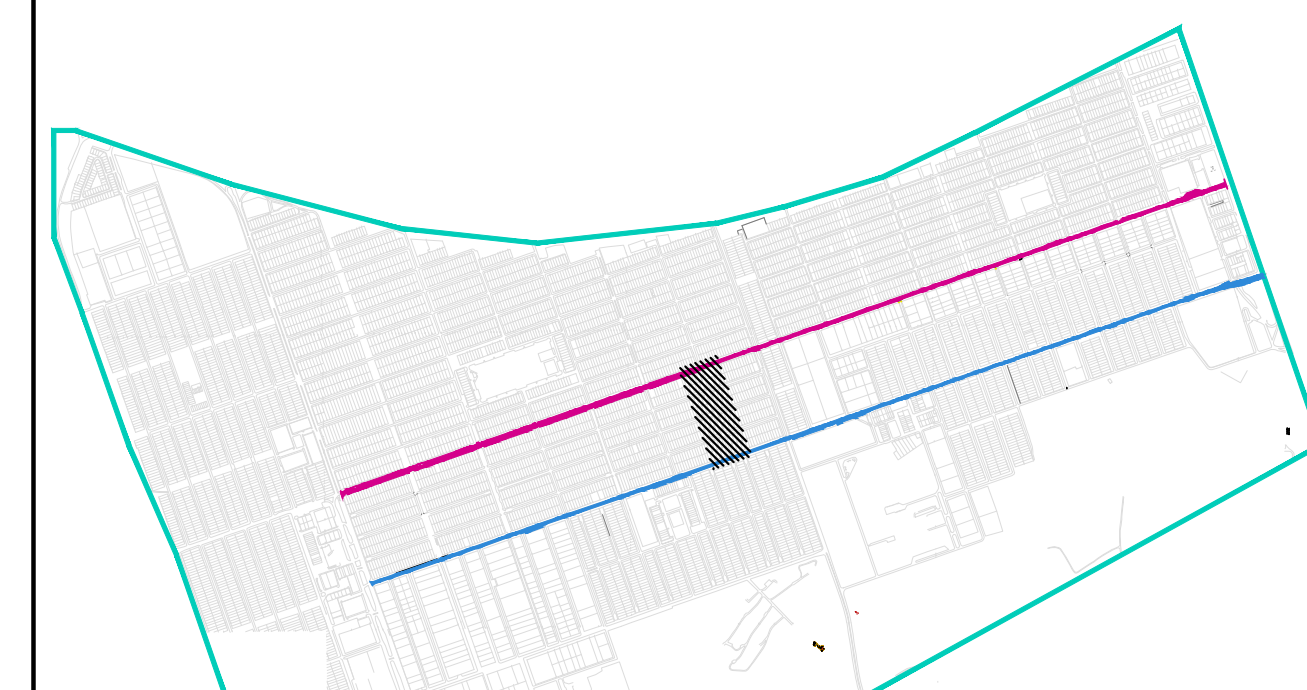
MAPA CHAVE TAGUATINGA NORTE