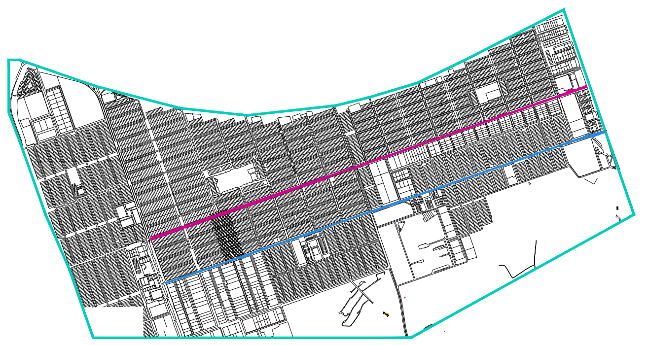
MAPA CHAVE TAGUATINGA NORTE