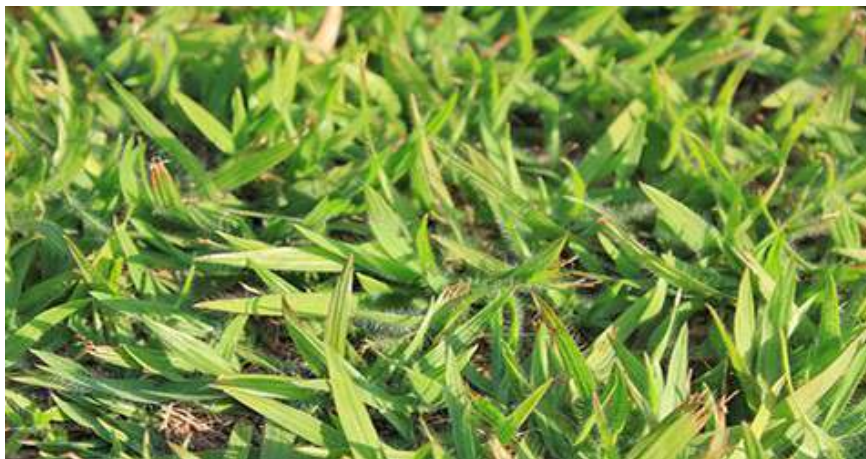
Imagem 01 - DIAVE/DPI: Grama batatais ( Paspalum notatum )