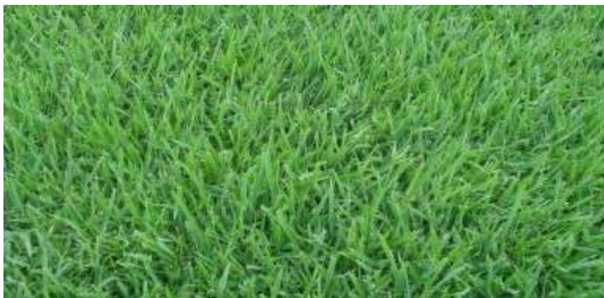
Imagem 02 – DIAVE/DPI: Grama esmeralda ( Zoysia japonica )