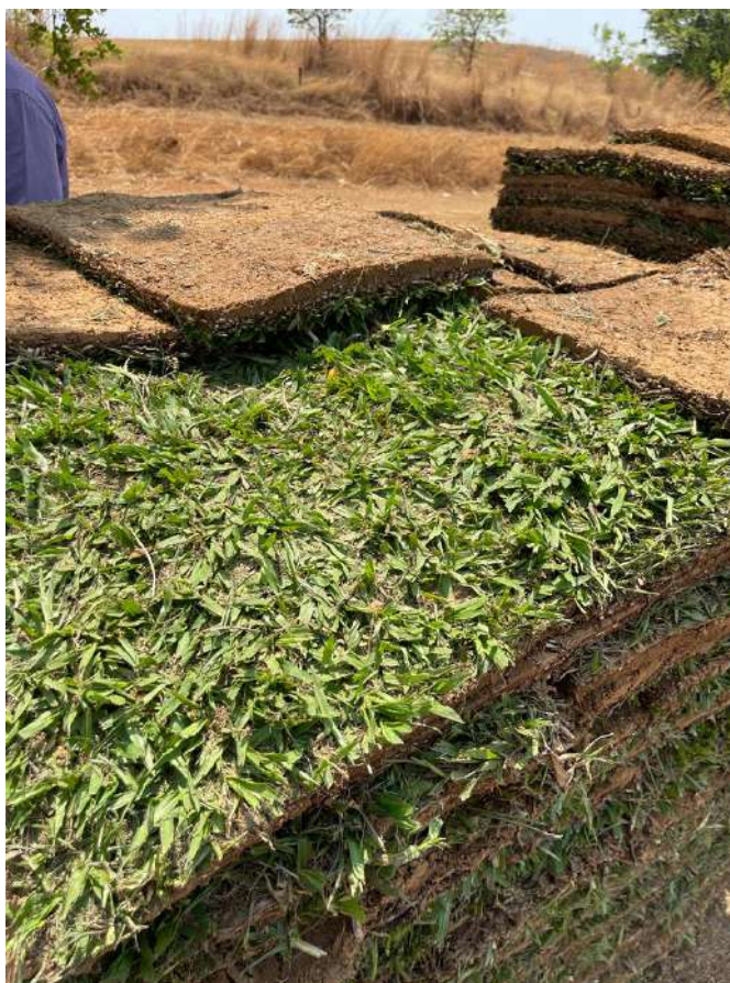
Imagem 04 - DIAVE/DPI: Grama batatais ( Paspalum notatum ) em formato tapete

2 - 40.000 m 2 de grama esmeralda em formato Big rolo nas dimensões de 10,00 x 1,00 x 0,03 m: