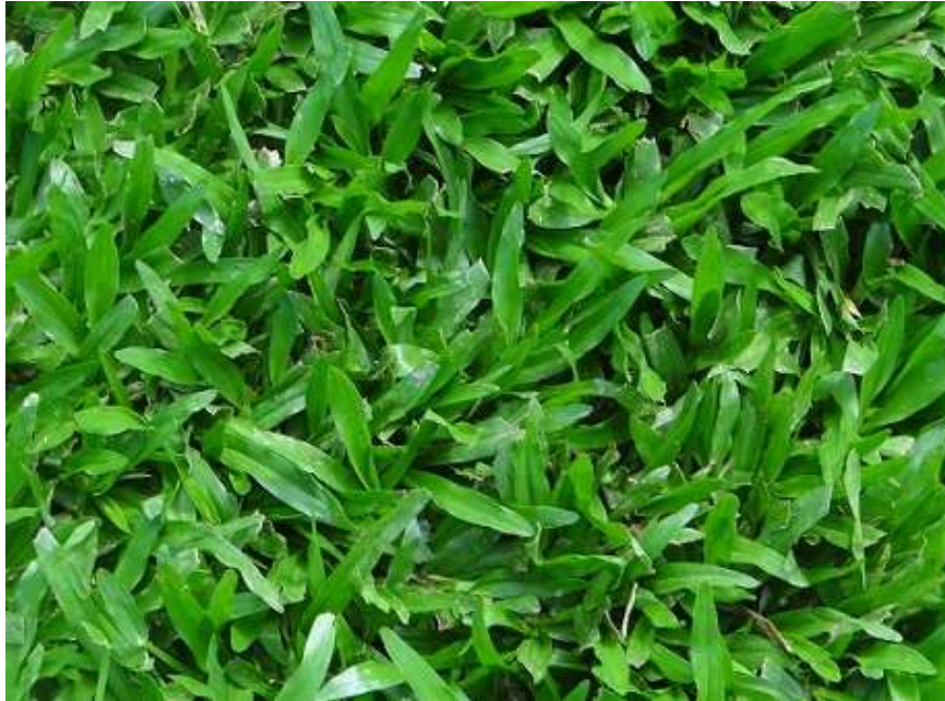
Imagem 03 – DIAVE/DPJ: Grama São Carlos ( Axonopus compressus )