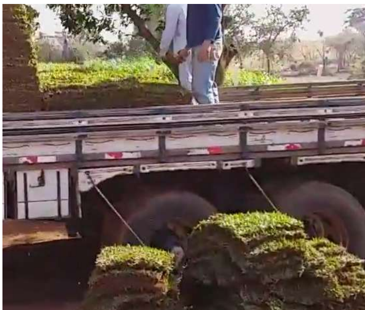
Imagem 06 – DIAVE/DPI: Grama são carlos ( Axonopus compressus ), em formato tapete***

Os pilotos visam realizar comparativos entre os plantios com as unidades de plantio convencionais e os novos formatos e avaliar o desempenho no que se refere: