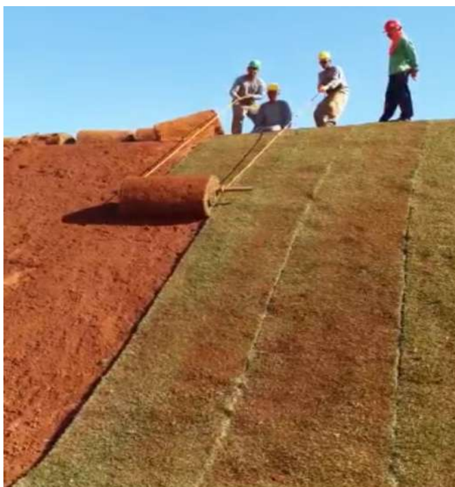
Imagem 05 – DIAVE/DPI: Grama esmeralda ( Zoysia japonica ), em formato big rolo

2 - 40.000 m 2 de grama esmeralda em formato Big rolo nas dimensões de 10,00 x 1,00 x 0,03 m: