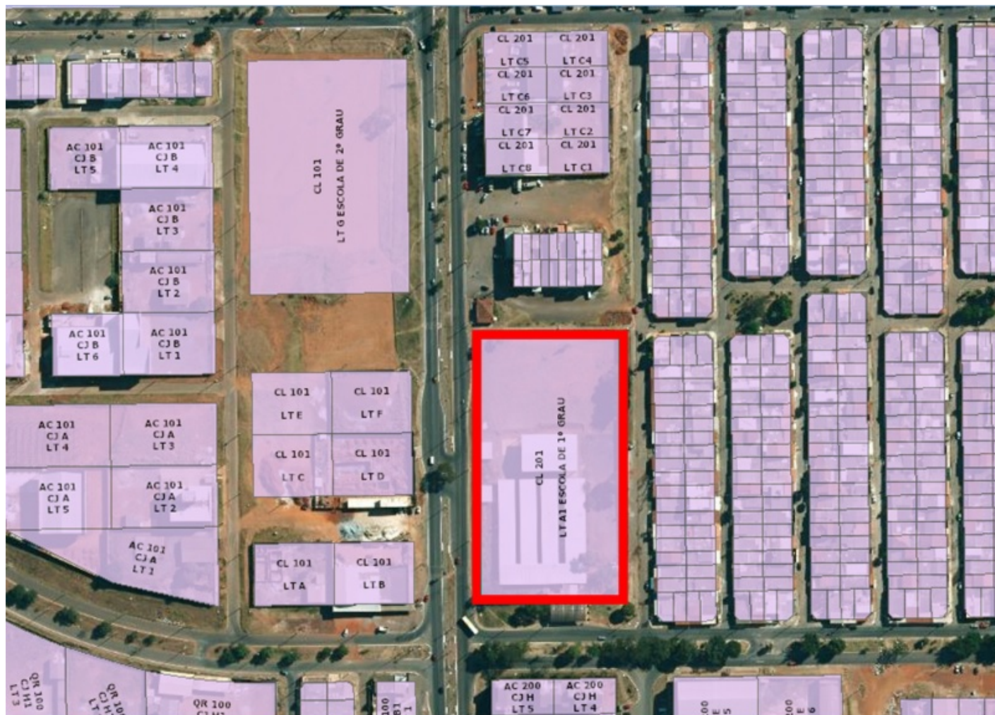
Imagem 01 - Implantação da creche na CL 201 Lote A1 - SANTA MARIA - DF.

Solicitamos gestões dessa Companhia no sentido de informar sobre o cadastramento de rede, bem como, informações acerca de possíveis interferências de redes existentes e projetadas para área em questão, conforme a imagem 01.