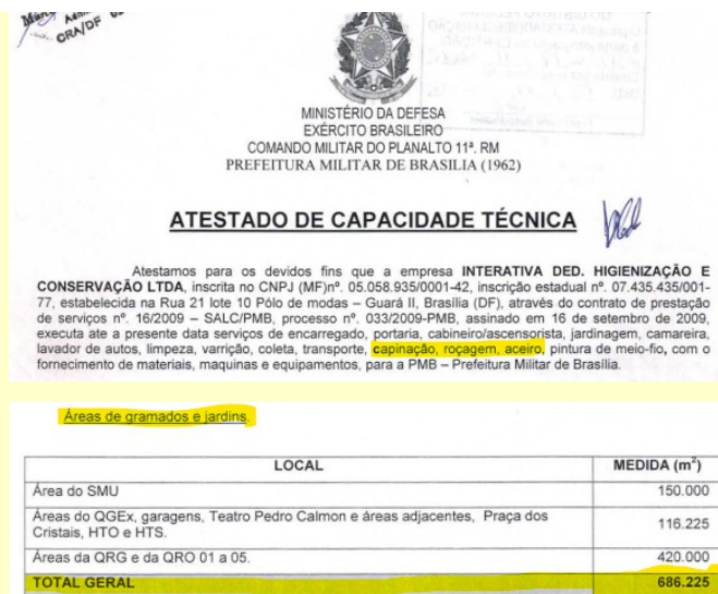
Imagem 2 - Atestado de Capacidade Técnica fornecido pela Prefeitura Militar de Brasília

7.7. Dentre os atestados apresentados encontra-se o Atestado de Capacidade Técnica emitido pelo DER, referente ao Contrato nº 045/2014, no qual, posteriormente, foi utilizado na argumentação do Recurso Administrativo da empresa Interativa, sob alegação que apenas este atestado seria suficiente para a comprovação da qualificação técnica da proponente, nos quantitativos previstos no Projeto Básico, item 10.4.3.2.