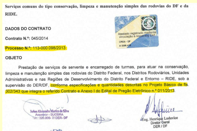
Imagem 3 - Dados do Contrato - Atestado de Capacidade Técnica do DER

7.9.2. Porém, destacamos que a análise da Novacap não ficou restrita apenas as informações contidas na documentação de habilitação, uma vez que o Atestado de Capacidade Técnica remete ao processo licitatório que originou o Contrato nº 045/2014, Processo nº 113-000.098/2023, no qual encontramos todos os dados inerentes ao citado contrato: